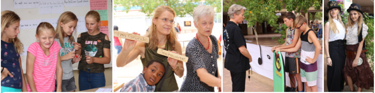
Lange Nacht der deutschen Sprache - Night of the German language

On the occasion of the 110th anniversary, a real “festive week” was held at the DHPS. In addition to the Orchestra Week of German Schools in Southern Africa - which was organised and hosted by the DHPS this year and culminated in the closing concert on 8 March 2019 - the Night of the German language, the Open Day and the cultural festival of the German Cultural Council (DKR) were also celebrated.