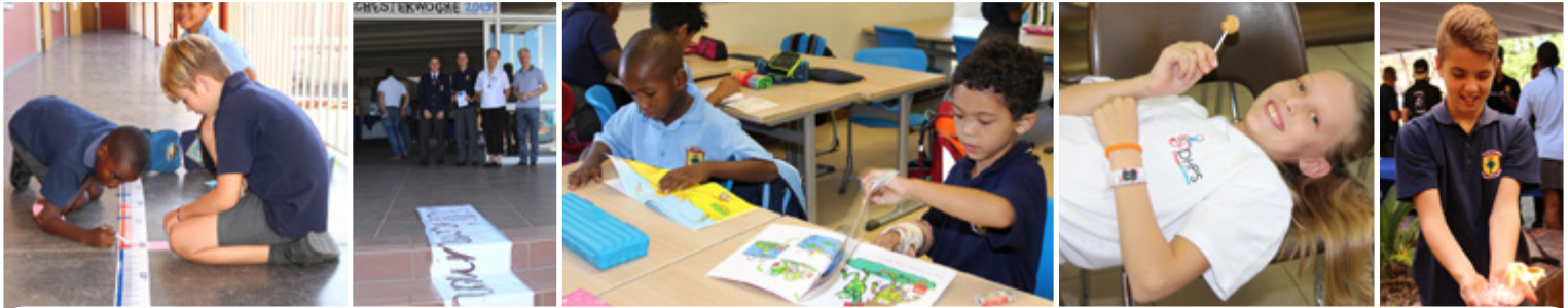
DHPS - Tag der offenen Tür - DHPS Open Day