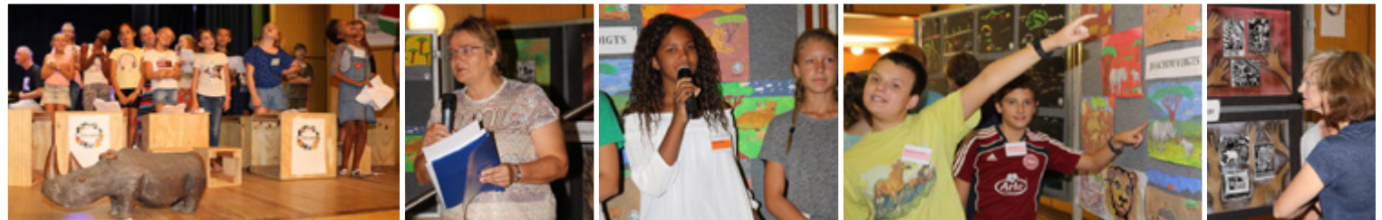
Kulturfest des Deutschen Kulturrats (DKR) - DKR Cultural Festival